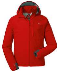
ショッフェルトロント4 コーヒーマシンを再利用したScape加工を施した消臭機能のある2.5層の防水ジャケット。左ポケットに収納できるPACKAWAY仕様。

アウターウェア …行動中の雨と風や雪などから衣服内を守る一枚地の全天候型ジャケット&パンツなど。ダウンジャケットもそうですが、行動中の防寒性はアンダーウェア~中間着①・②に任せて、防風性と透湿防水性を重視します。冬の低山ぐら