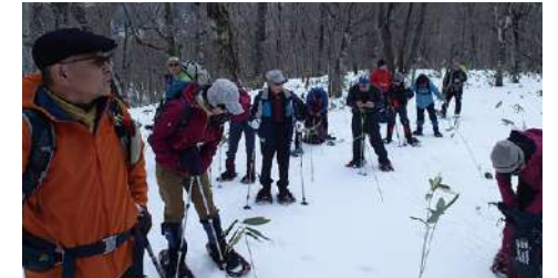
スノーシューを使用して、無積雪期には歩けないところを楽しむ。自分でルートを選ぶ自由さに溢れている。

雪山と言ってもその様相は山域、標高、時期によっても大きく異なります。楽しみ方も、スノーハイクから高山の雪稜縦走、雪壁・氷瀑登攀、歩き自体を楽しむスノーシューイング（スノーシューを使った歩き）や歩くスキー等々……、無積雪期以上の広がりとお楽しみがあります。