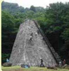
ロッククライミング 訓練施設

登山のための研修に、ロッククライミング訓練施設、スポーツクライミング用人工壁、講義室、宿泊室等を団体でご利用ください。