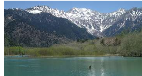
春の山麓を歩くのは爽やかなものです。残雪の アルプスを眺めながら自然を楽しみましょう。

溪流歩きには、流れの速さや飛沫、両岸を彩る色合い、薫りを映す季節とその繊細な移ろいなど、流水に山の潤いと水際の清涼感を満喫できる魅力があります。遊歩道を外れた溪流歩きでは、濡れ対策と急な増水時の避難路も頭に入れましょう。