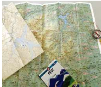
地図も多様。スマホ用地図アプリも便利ですが、国土地理院の地形図を携行し読めるように。

登山用地図は、国土地理院発行の2万5千分の1地形図を使います。この地形図では①位置と高さ②地点間の水平距離と高低