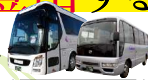
貸切バス 大型~マイクロ/ハイエース