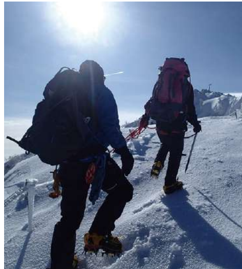
雪面の登下降では、しっかり足を踏み込みましょう。

夏山でも風雨に晒されることで起こります。症状は寒気を訴え、小刻みに震えがきて、身体を擦る行動をとる、ただボーとして動きが