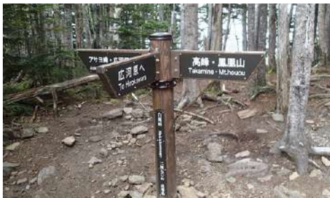
登山道上の標識は必ずチェック。進行方向を確認します。

低山は、仕事道、枝道も縦横にありコースを誤ることがあります。低山は、高山より地形を読み難いことも多いので注意が必要です。