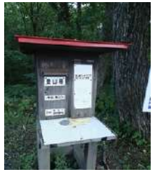
登山口では、登山計画書または登山届を提出しよう。

登山計画は提出するものとの認識が普通でしたが、「共有」という考え方も普及し始めました。つまり、友人、家族など大切な人と登山計画を共有することで安全・安心をより高く求めるといえます。