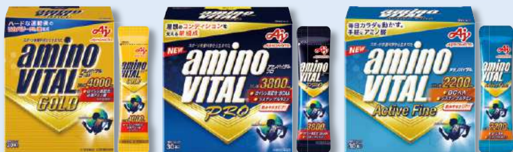
「アミノバイタル ® GOLD」 30本入箱