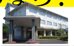
月岡温泉街“華灯” 宿泊特化型和風ホテル