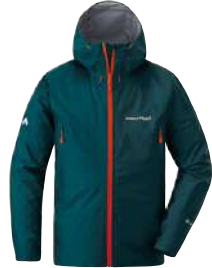
モンベル ストームクルーザージャケット Men's 卓越した防水性・透湿性、そして軽量を備えたレインウェアです。ウインドブレーカーとしても活躍します。

アプローチや里山・山麓ウォーキングなどでは折り畳み傘の使用も可能ですが、それ以上高い山では、上下セパレートのレインウェアがベストです。高い防水性のほかに、内部のムレを逃がす透湿防水素材やメッシュ・ライニングを使ったものがお勧め。冬の低山ぐら