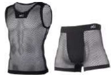
ドライナミック メッシュ NS クルー ドライナミック メッシュ ボクサー 一年を通して発汗による“冷え”と“不快感”を軽減する、究極のドライ感を実現した次世代のアンダーウェア。

や速乾性に重点を置き、春、秋、冬の寒冷時期には加えて高い防寒性を持つ、高機能ケミカル素材を使ったもので(ウール素材も可)、季節と気温に