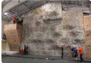
スポーツクライミング用人工壁