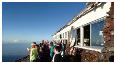
グループのリーダーは、全体を統率します。メンバーの調子を考えながら登山を進めていきます。

ビギナーの単独登山はあまりすすめられません。それでもという場合は自己完結の責任が求められます。家族や仲間同士の登山では、経験・体力・技術が最も劣る人に合わせた計画と行動が必要です。仲間同士でも意思決定を担うリーダーを決めるのが原則です。日程・コース・同行者・携行品など、必ず家族や友人と共有します。