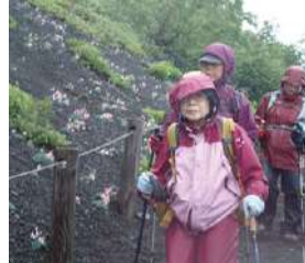
レインウェアはどんなときにも携行しましょう。透湿防水性に優れ上下セパレートなもの。

レインウェアは、たとえ天気予報で晴れといわれていても必ず持っていきます。山の天気は変わりやすいものです。最近のレインウェアは防風着として兼用できます。また、それ故に幾分の保温効果もあります。ジャケットとパンツのセパレートタイプが必要です。二つ目は、ヘッドランプ。万一の場合日暮れになっても行動ができます。山には街灯はありません。三つ目は、地図とコンパス(磁石)です。現在位置の把握と目的地の把握するために必要です。これら三つは、いざというときに役に立ちます。