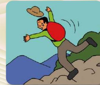
転倒・転落・滑落