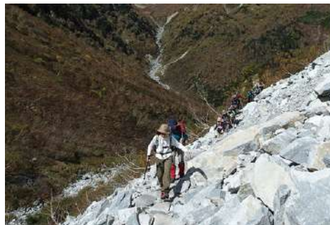
岩場の通過では落石を発生させぬよう、標識や目印に従って慎重に上り下りしましょう。

日本の名だたる山々は、多くが火山です。火山に対する注意も怠りがあってはなりません。火山ガスは、登山道に危険地帯の表示があるのでその指示に従うことで危険回避ができます。火山噴火は、気象庁の「火山登山者向けの情報提供ページ」（ http://www.data.jma.go.jp/svd/vois/data/tokyo/STOCK/activity_info/map_0.html ）を参照し、事前情報を入手しておきましょう。