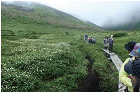
木道は、足元をよく見て歩きましょう。継ぎ目などの引っ掛かりに注意し転倒しないよう心がけよう。意外と大けがを負います。

スピードは平地の半分くらい。リズムは数歩以上先を見てバランスよく、足場の安全を確認し、歩幅は狭く肩幅以下程度にして歩きます。