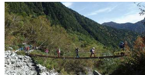
登山道ではつり橋などもあります。渡るときは、荷重制限もあります。人数制限など注意が必要です。